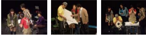
写真は、今年春のツアー『面白半分』より。 各都市にて大好評をいただきましたが、次回作『ONE DAY』は、これを上回る作品を作るぞっ！

第36回公演『ONE DAY』 作・演出/村木藤志郎 土田真巳 9月17日(月・祝) 名古屋/セツ寺共同スタジオ 9月29日(土) 大阪/心斎橋ウィングフィールド 10月6日(土)～14日(日) 東京/浅草橋アドリブ小劇場 10月27日(土) 札幌/演劇専用小劇場 BLOCH