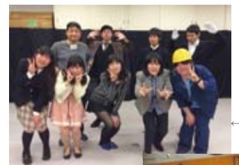
←雪谷高校演劇部の皆様と記念撮影！

うわの空・藤志郎一座の台本化されている作品につきまして、上演許可は事前にいただきますことをお願いしておりますが、高校生の皆様の上演につきましては、原則上演料なしでお受けしております。台本を読んで興味を持って下さった高校生の皆様、ぜひ劇団までご連絡くださいませ！