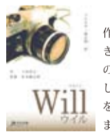
↑※『Will (ウィル)』は、短編で上演時間1時間弱の脚本。高校生の皆様を持って来いなんですよ～！

その後、4月にもキャストを入れ替え上演して下さったとお知らせいただきました。『Will』を愛して下さって大感謝！！雪谷高校演劇部の皆様、先生、本当にありがとうございました！