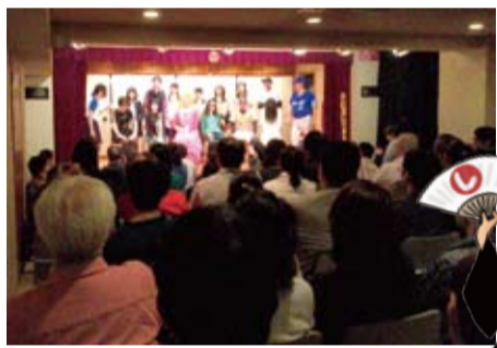
今しか見られない、 今しかできない、生だからこの 魅力がたっぷり。ぜひ一度お越しを。

夜は、劇団の定番コンテンツ『うわの空 LIVE』。東京コメディを意識した舞台を行っているうわの空の、「笑い」の要素だけをぎゅっと詰めたお笑いライブです。生のライブだからできる笑い、今このタイミングでしかできない旬の笑いを、劇団員総出演でお届け致します。なんと、8月で78回目・・・！ 昼と夜で、完全別プログラムの二本立て！どうぞお楽しみに。